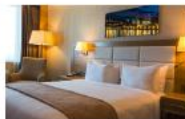
Habitación doble con cama de matrimonio