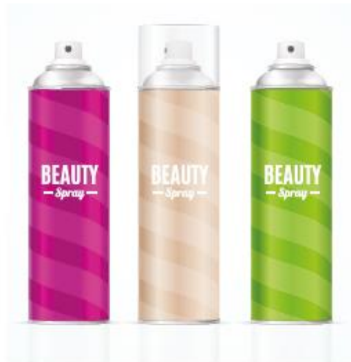
Figura 2.12. Envases aerosol, con materiales de aluminio y plástico.