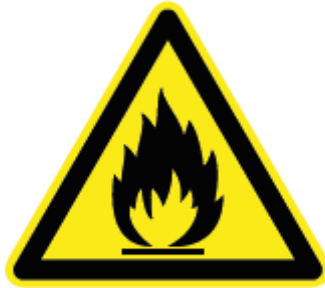
Figura 1.53. Peligro de incendio.