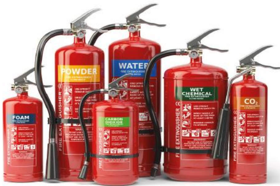
Figura 2.51. Se debe utilizar el extintor adecuado para cada caso.