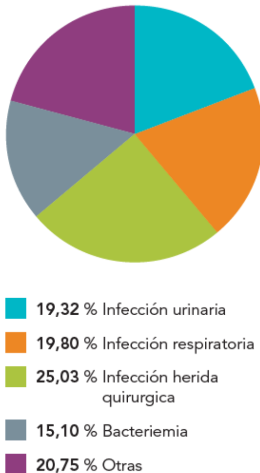
Figura 3.7. Resultados globales de la localización de las infecciones nosocomiales (EPINE 2017).

Se ha actualizado la Figura 3.7. , incluida su leyenda.